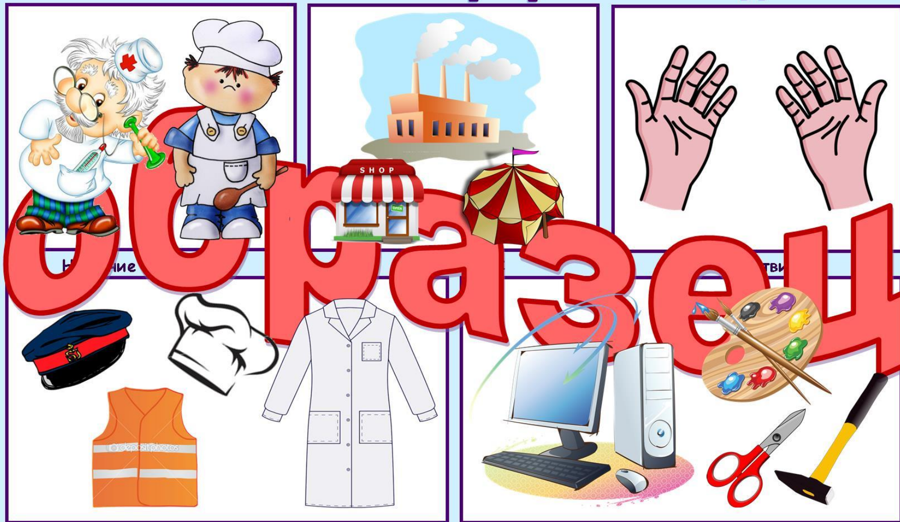
Форменная одежда -