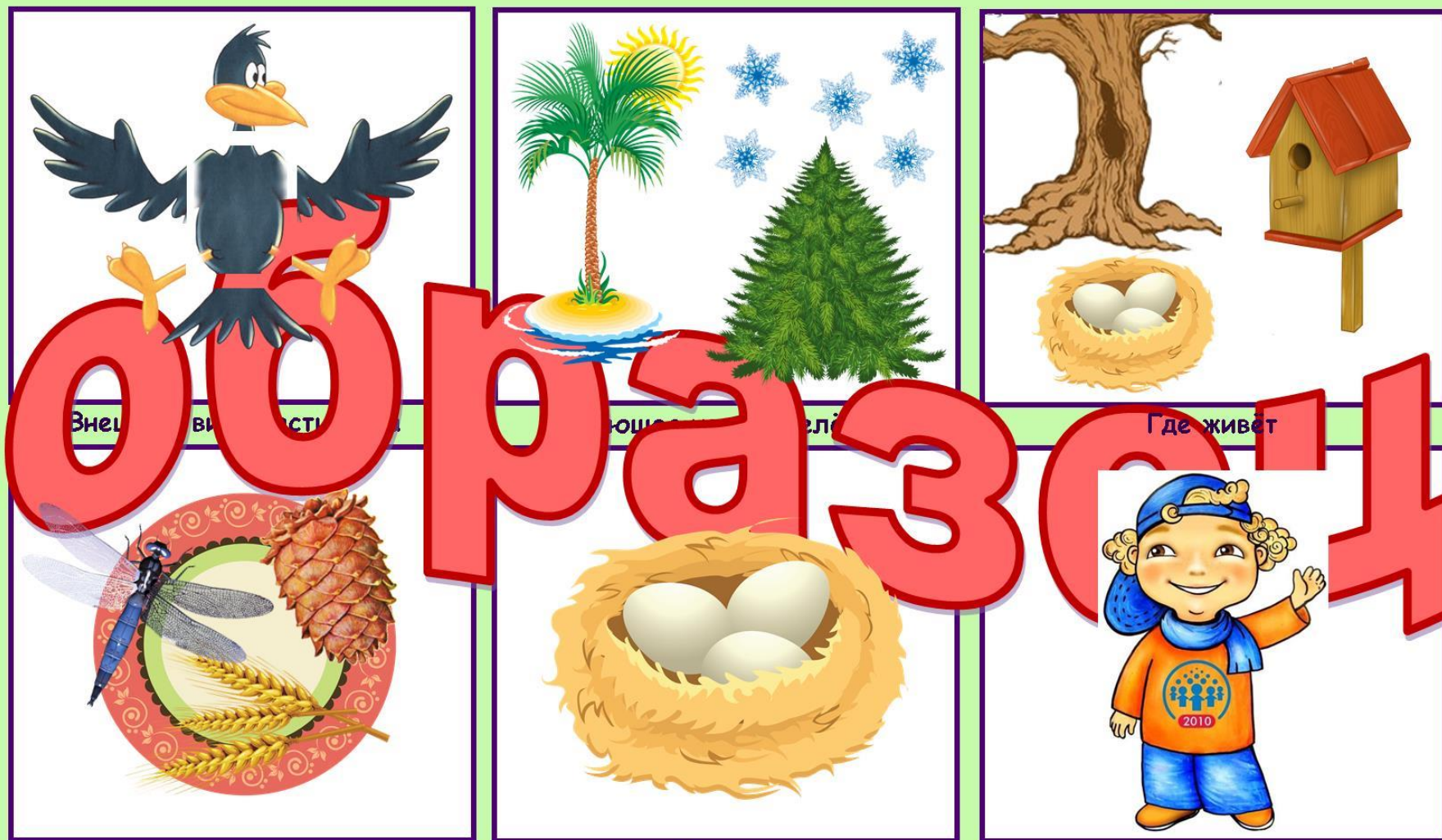
Схема описания птиц