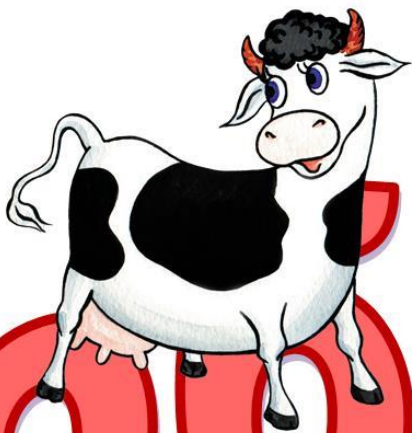
Внешний вид, части тела