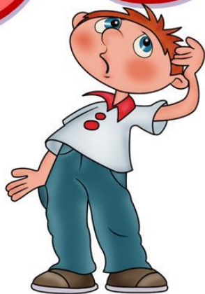
Какую пользу приносит человеку